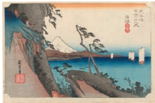
静岡市東海道広重美術館 蔵

3号車マルチカーで、歌川広重「東海道五拾三次之内」(保永堂版)※複製版画の展示を実施いたします。日本橋～京都までの全55枚、日本を代表する浮世絵芸術をお楽しみください。