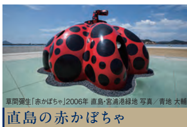
草間彌生「赤かぼちゃ」2006年 直島・宮浦港緑地