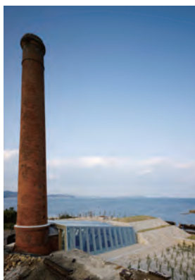
犬島精錬所美術館

近代産業遺産でもある銅の製錬所跡を再生した「犬島精錬所美術館」や、犬島の集落で展開される犬島「家プロジェクト」など、アートの島として注目されています。