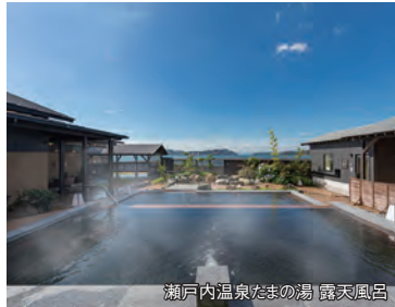
瀬戸内温泉たまの湯 露天風呂