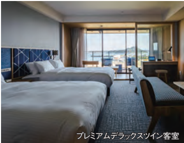
プレミアムデラックスツイン客室