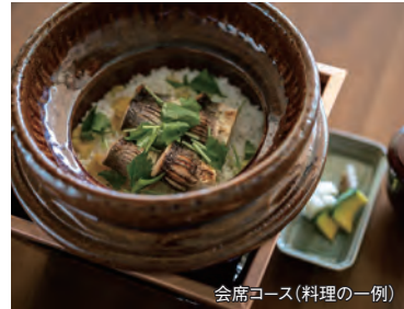
会席コース(料理の一例)