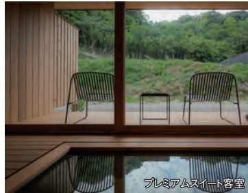
プレミアムスイート客室