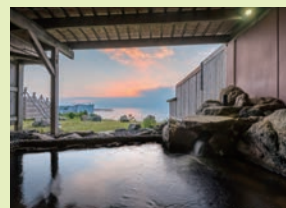
和風露天風呂/イメージ