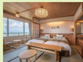
和室プレミアムツインベッドルーム/一例