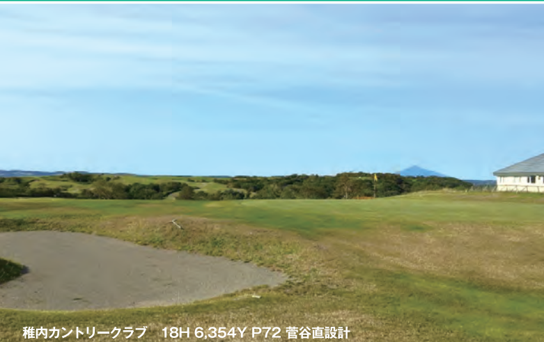
稚内カントリークラブ 18H 6,354Y P72 宮谷直設計