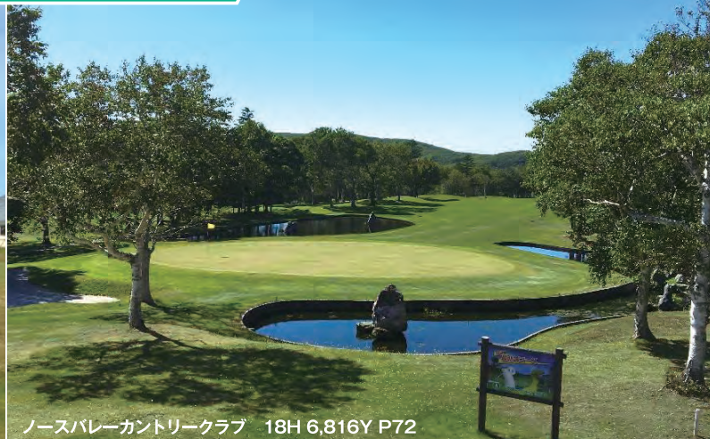
ノースバレーカントリークラブ 18H 6,816Y P72

西に利尻富士、北にサハリンを望む眺望、荒涼と佇むリンクスは、日本のでっぺん「稚内」ならではの。