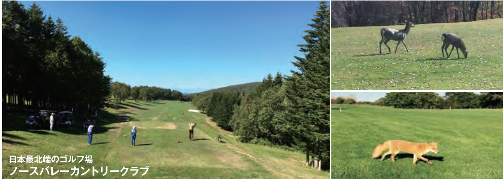
日本最北端のゴルフ場 ノースバレーカントリークラブ