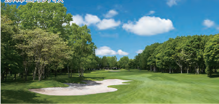
恵庭カントリー倶楽部(摩周・阿寒・支笏) 27H 11,029Y P108 富澤廣親設計 1991年開場