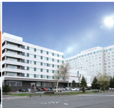
ANAクラウンプラザホテル千歳(お部屋一例/シングルルーム)