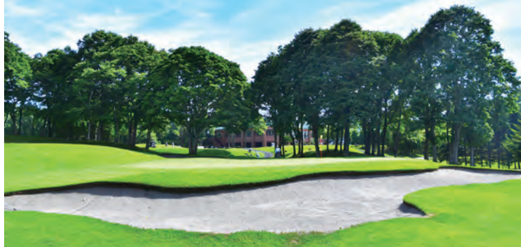
札幌国際カントリークラブ・島松コース(A~B) 18H 6,915Y P72 菅谷直、間野貞吉設計 昭和38年開場