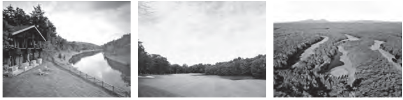
ホテル ニドム 外観/イメージ 桂ゴルフ倶楽部 ニドムクラシックコース(ニスパコース)