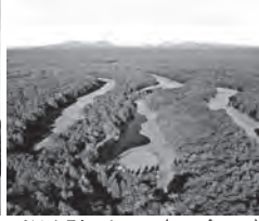
ニドムクラシックコース(ニスパコース)