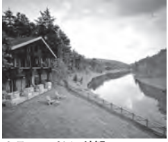
ホテルニドム 外観