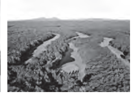
ニドムクラシックコース(ニスパコース)