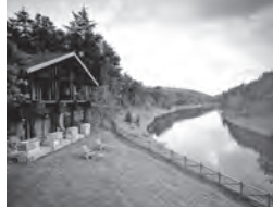
ホテルニドム 外観/イメージ