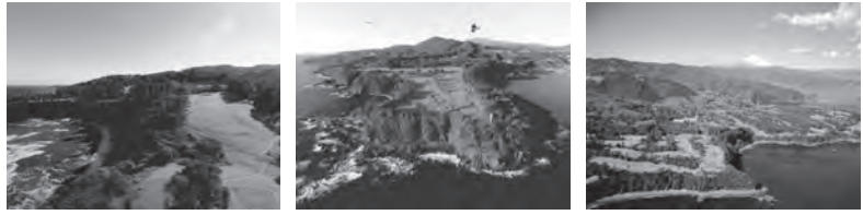
川奈ホテルゴルフコース(大島コース)/イメージ 川奈ホテルゴルフコース(富士コース)/イメージ 川奈ホテルゴルフコース 全景/イメージ