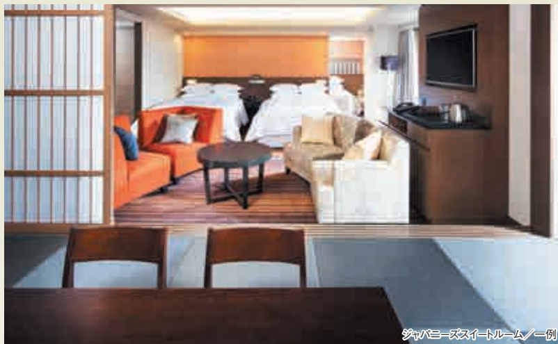
ジャパニーズスイートルーム／一例