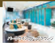
ドッグフレンドリーラウンジ

■ 客室1室あたりワンちゃん2匹までとなります。※ワンちゃんの体重は15kgまで ■ ドッグフレンドリールームのご利用にあたり、事前の狂犬病予防接種・混合ワクチン接種が必要となります。(接種後2週間以上かつ1年未満) また、チェックイン時には「宿泊滞在同意書」へ必要事項のご記入をお願いします。 ■ 宿泊代金には、ワンちゃんの宿泊代は含まれていません。ご宿泊にあたり、清掃代として1滞在、1部屋につき5,500円(税込)、ワンちゃんのご宿泊代として1泊、1匹あたり2,500円(税込)をチェックインの際別途お支払いいただきます。 ■ ご到着後、お部屋に入る前にドッグラウンジにてエチケットサービスを受けていただきます。(おしりのケア/ネイルカット/イヤークリーニング/ブラッシング)