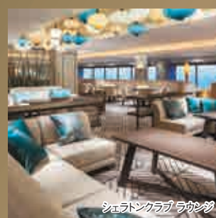
シェラトンクラブ ラウンジ

・4歳以上の添寝のお子様は別途ラウンジ利用 料がかかります。現地でお支払いください。