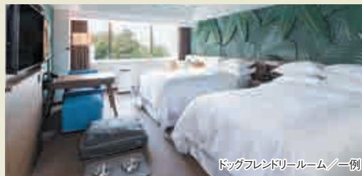
ドッグフレンドリールーム／一例