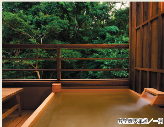
客室露天風呂一例