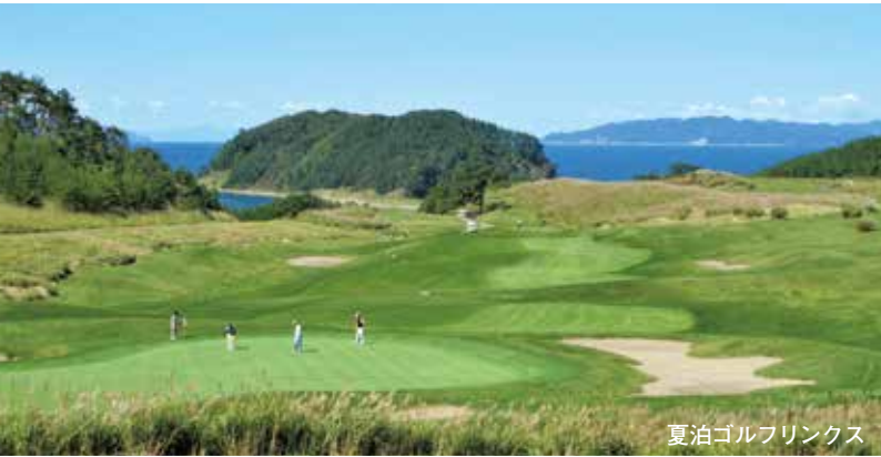
夏泊ゴルフリンクス