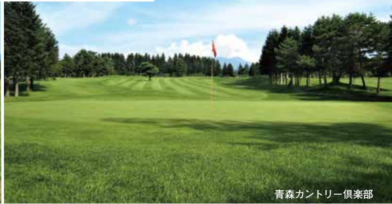
青森カントリー倶楽部