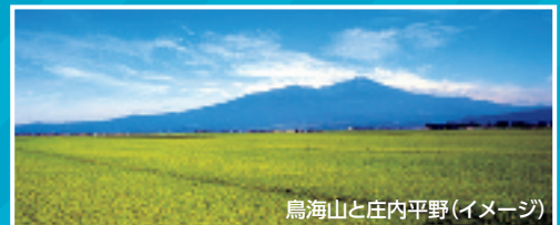
鳥海山と庄内平野(イメージ)