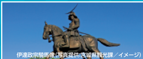
伊達政宗騎馬像

※Go To キャンペーン適用には条件がございます。必ずお申し込みの前に参加条件をご確認ください。予約締結後であってもキャンペーン対象とならない方がいらっしゃった場合は旅行契約を解除いたします。