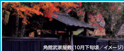
角館武家屋敷(10月下旬頃 / イメージ)