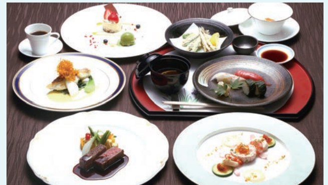
G7広島外相会合再現メニュー