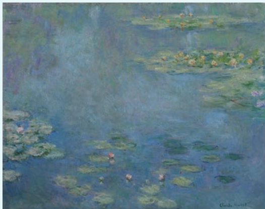
大原美術館所蔵/《睡蓮》クロード・モネ