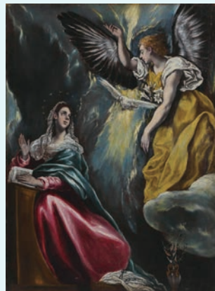
大原美術館所蔵/《受胎告知》エル・グレコ