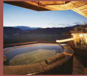
客室展望露天風呂