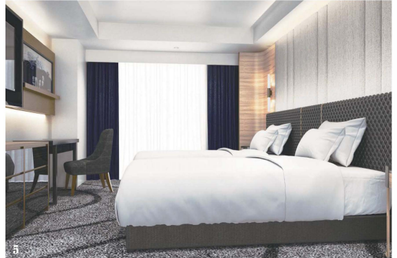
1. ザ ガーデン ブラスリー&バー 2.朝食 3.ルーフトップバー 4.クラブツインルーム 5.スイートルーム