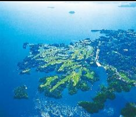
パサージュ琴海アイランドゴルフクラブ 空撮/イメージ

1日目は雄大な半島の自然を活かした「ペンシユラオーナーズゴルフクラブ」でプレイ！ 2日目は2015年度 日本女子ゴルフ選手権大会 コニカミノルタ杯開催の「パサージュ琴海アイランドゴルフクラブ」でプレイ！ 宿泊はパサージュ琴海アイランドゴルフクラブと隣接の「ホテルパサージュ琴海」。