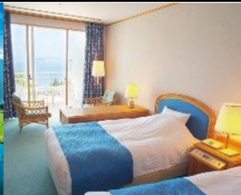
ホテルパサージュ琴海 客室スタンダードツイン/イメージ