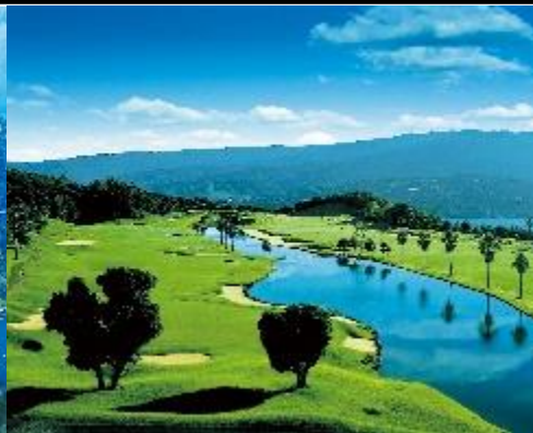
ペンシユラオーナーズゴルフクラブ コース/イメージ