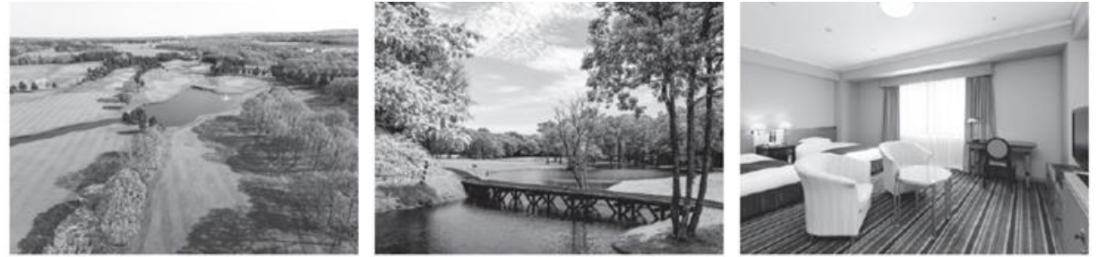
北海道クラシックゴルフクラブ/ ニドムクラシックコース イコロコース 札幌エクセルホテル東急 客室イメージ ピリカ 5番ホール/イメージ ツイン/イメージ

【ニドムクラシックコース】(イコロコース) 2003年度『日本プロゴルフマッチプレー選手権』、2006年度『日本女子プロゴルフ選手権』開催の北海道を代表するコース。 【北海道クラシックゴルフクラブ】(オールベント芝コース) ※ オールベント芝コースとは…通常グリーンに用いられるベント芝をフェアウェイ全面に用いた贅沢な造りのコースです。 コースはどこまでもフラットに広がる原野の柏の喬木をくり抜いたようなレイアウトで、池が絡むホール、バンカーがガードするホールなど、パラエティに富み、それぞれが個性を主張する、ジャック・ニコラウスならではのデザインのコースに仕上がっています。