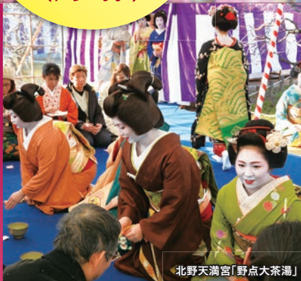
北野天満宮「野点大茶湯」