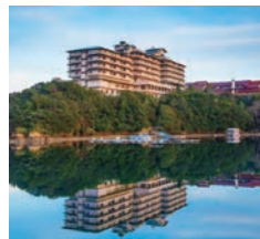
ザ クラシック 外観

英虞湾を望む丘の上に立地し、建築家・村野藤吾氏の設計による落ち着いた空間で時を過ごすザ クラシックは、2016年G7伊勢志摩サミットの会場にもなりました。ご夕食は「海の幸フランス料理」をお召しあがりください。