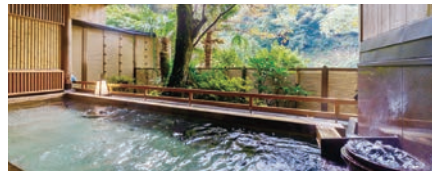
露天風呂「かげろうの湯」(女性用)