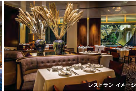
レストラン イメージ

緑に囲まれた静かな空間で、25メートルの広々と本格広東料理レストラン「サマーバビロン」と多彩なシンガポール料理を味わえる「コロニー」。