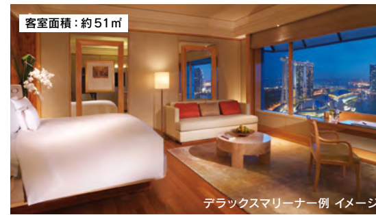
デラックスマリナー一例 イメージ