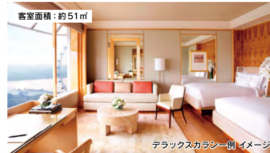
デラックスカラン一例 イメージ

客室のベッドは寝転んだ状態でも外の景色が見えるように高くゆったりしたサイズです。