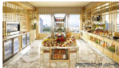
クラブラウンジ イメージ

ホテル最上階にあるザ・リッツ・カールトン・クラブラウンジはシンガポールの摩天楼を眺めながらゆったりくつろげる特別な空間です。