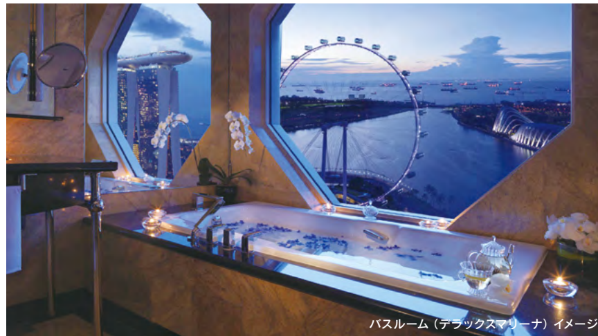
バスルーム(デラックスマリナー) イメージ

マリナーエリアの中心に位置するラグジュアリーホテルです。シンガポール・フライヤーなどのアトラクションに近く、マリナー・ベイの景色を眺めながら歩いて散策いただける絶好のロケーションです。