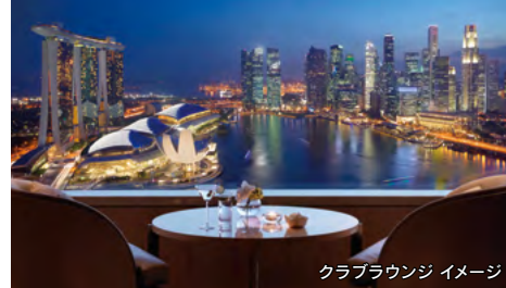
クラブラウンジ イメージ

※チェックインからチェックアウトまでの間にご利用いただけます。 ※営業時間6:30-23:30(12歳未満のお子様は18:00まで) ※コロニー(朝食会場)での朝食をご希望の場合、朝食代金を直接ホテルへお支払いとなります。 ※利用特典に含まれないもの：●客室またはクラブラウンジでのパーソナルチェックイン/チェックアウト●ご滞在のお手伝いをするクラブラウンジ専用のコンシェルジュ●午前7時から午後10時までホテル周辺への無料リムジンサービス●最大10名様までのミーティングにご利用いただけるライブラリー