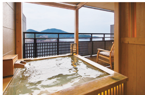
部屋露天風呂の一例