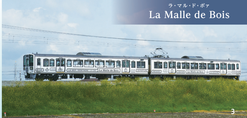
ラ・マル・ド・ボア La Malle de Bois

1:観光列車「etSETOra(エトセトラ)」 2:「etSETOra(エトセトラ)」車内 3:観光列車「La Malle de Bois(ラ・マル・ド・ボア)」