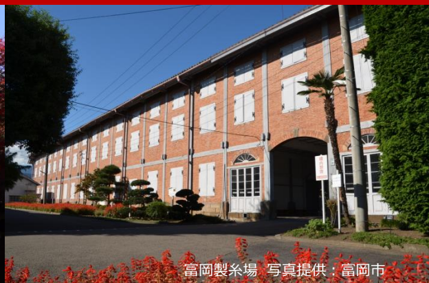
富岡製糸場