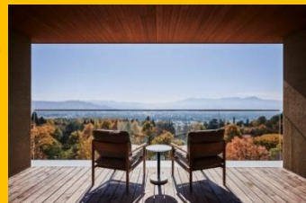
5階オールデイダイニングのテラス

2021年3月、雄大な自然に囲まれた浅間山の麓に誕生。 すべてのお部屋に広々としたテラスや半露天風呂温泉を備えています。「森のグラン・オーベルジュ」をコンセプトに、恵まれた自然環境を活かした新しいオーベルジュ体験をお楽しみください。