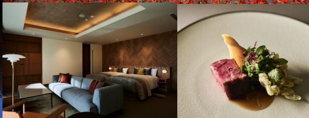
ホテル 客室の一例・料理イメージ