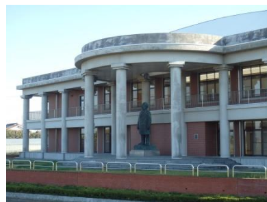
渋沢栄一記念館

■ラグジュアリーバス「ロイヤルロード・プレミアム」について、詳しくは下記のURL、右のQRコードをご参照ください。（JCBトラベルウェブサイトにつながります。）