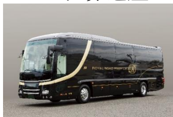
バス 外観、車内イメージ