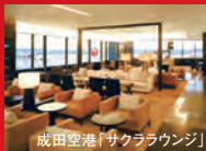
成田空港1サクララウンジ

■出発前のラウンジでちょっとリッチな気分 出発前のひとときをくつろぎの空間でお過ごしください。出発時間に合わせたダイニングサービス、落ち着いたバーでの一杯、リラクゼーションスペースやインターネットサービスなど旅の始まりがJALビジネスクラスならもっと快適に。