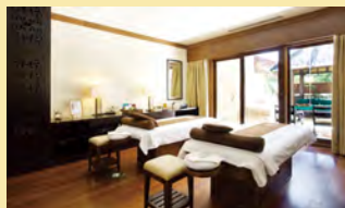
アヨディア スパ バイマンダラ (アヨディア リゾートバリ)

旅程2日目と3日目は「1ラウンド ゴルフプレー」または 「120分スパパッケージ」いずれかをお楽しみいただけます。 ゴルフをめいっぱい楽しみたい方、ゴルフは1日だけ にしてリラックスタイムも楽しみたい方など、お客様それ ぞれのお好みで、バリ島ステイをお過ごしください。