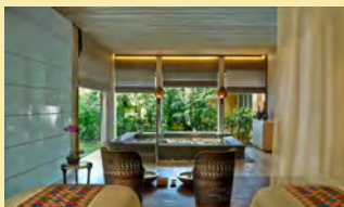
ザリッツカールトン スパ バリ (ザ・リッツ・カールトン バリ)