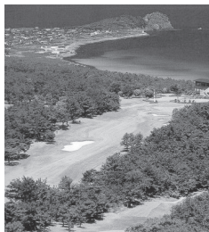
芥屋ゴルフ倶楽部/イメージ