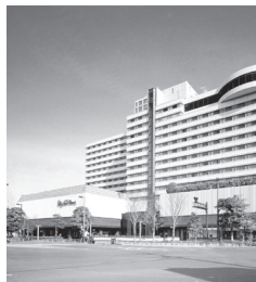
ホテルニューオータニ博多 外観/イメージ