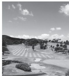
福岡国際カントリークラブ/イメージ