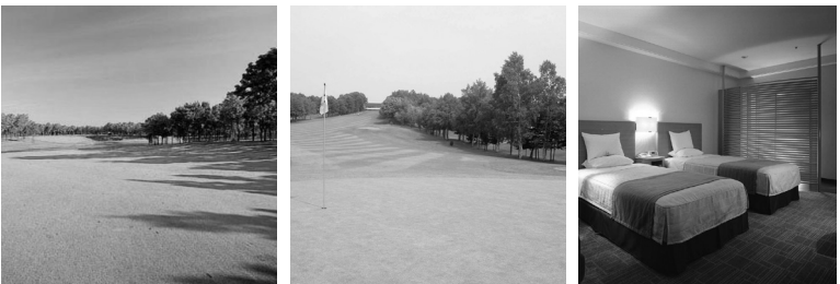
北海道クラシックゴルフクラブ 札幌ゴルフ倶楽部 輪厚コース ホテルオークラ札幌 客室