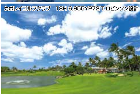
カボレイゴルフクラブ 18H 6,955YP72 T.ロビンソン設計