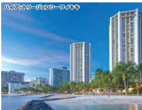
ハイアットリージェンシーワイキキ