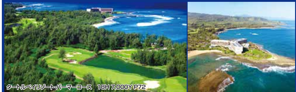
タートルベイリゾート・パーマコース 18H 7,000Y P72