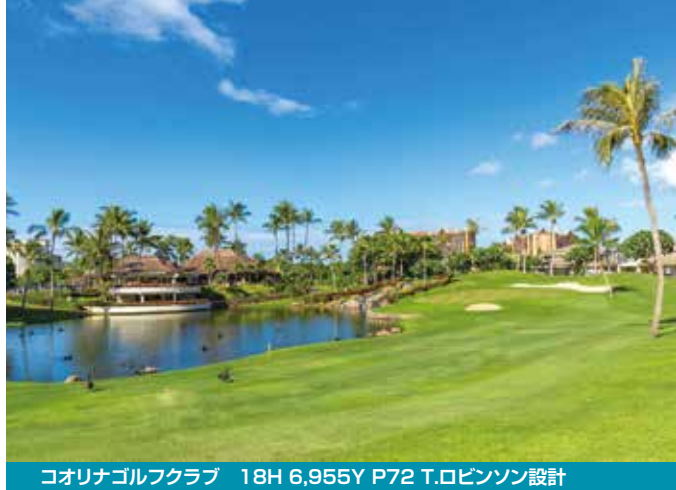
コロナゴルフクラブ 18H 6,955Y P72 T.ロビンソン設計

1947年から続く歴史ある大会にふたりの日本人プロの名前(1983年・青木功、2022年・松山英樹)が刻まれる、ソニーオープンinハワイの予選・決勝2日間観戦し、LPGAツアー開催コースのコロナGCとカボレイGCの2プレー! 賑やかなワイキキと対照的な、のどかで落ち着いたリゾート“タートルベイ”も楽しみです。