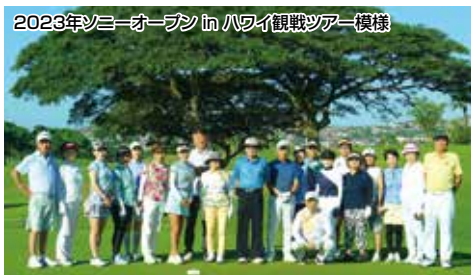
2023年ソニーオープンinハワイ観戦ツアー模様