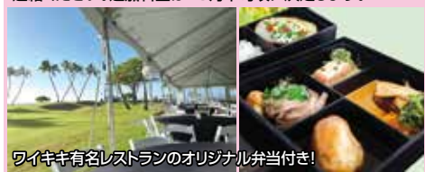
ワイキキ有名レストランのオリジナル弁当付き!

16番ホール・セカンド地点にあるホスピタリティテント付観戦券にアップグレード(有料)可能です。ご希望の方は担当者にご連絡ください。追加料金は10月中旬頃に決定します。