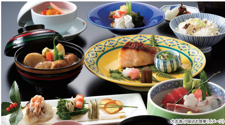
大志満 汐留店お食事(イメージ)

行程 9:40東京駅出発 (丸の内南口) 東京宝塚劇場 JCB貸切 宝塚歌劇雪組公演鑑賞 (11:00開演) 14:30頃 ザ ロイヤルパークホテル アイコニック 東京汐留「大志満」(懐石料理の昼食) 16:30東京駅着・解散