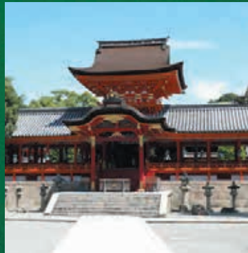
石清水八幡宮 社殿外観

平安時代から、国家鎮護や必勝の神として篤く信仰されてきた歴史ある社へ。国宝にも指定された、古代の荘厳さと近世の装飾を兼ね備えた境内や昇殿までを神職の案内でめぐります。