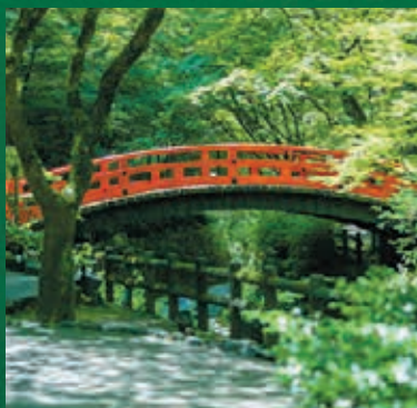
北野天満宮 御土居 青もみじ(見ごろ:4月中旬~6月下旬)

「祓いと清めの聖地」とされる北野の地で、菅原道真公を祀る全国天満宮・天神社の総本社を参拝。御土居を彩る約350本の青もみじに包まれ、心洗われるひとときが過ごせます。