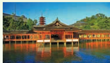
厳島神社

日本三景「安芸の宮島」を訪れ、海に浮かぶ姿が幻想的な世界遺産・厳島神社を地元公認ガイドと散策。推古天皇の御代から多くの貴人に崇敬されてきた、奥深い歴史と美にひたります。