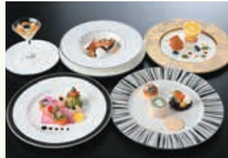
G7広島サミット2023アレンジメニュー