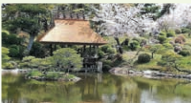
縮景園 悠々亭(桜の見ごろ:3月下旬~4月上旬)

築庭400年以上の大名庭園は、広島市内の中心部にありながらも緑豊かな憩いの場。江戸の大火や大戦の惨禍を乗り越えて復旧し、季節の花々や草木の輝く姿に心癒されるひとときが過ごせます。