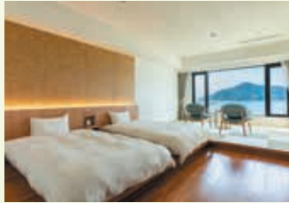
客室(スタンダード和洋室)の一例

江田島の豊かな自然に包まれた宿は、すべてのお部屋が穏やかな海を臨む、ゆったりとくつろげる雰囲気。地元食材を活かした料理や、希少な療養泉に癒されて、明日への活力を養えます。