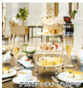
アフタヌーンティー/イメージ