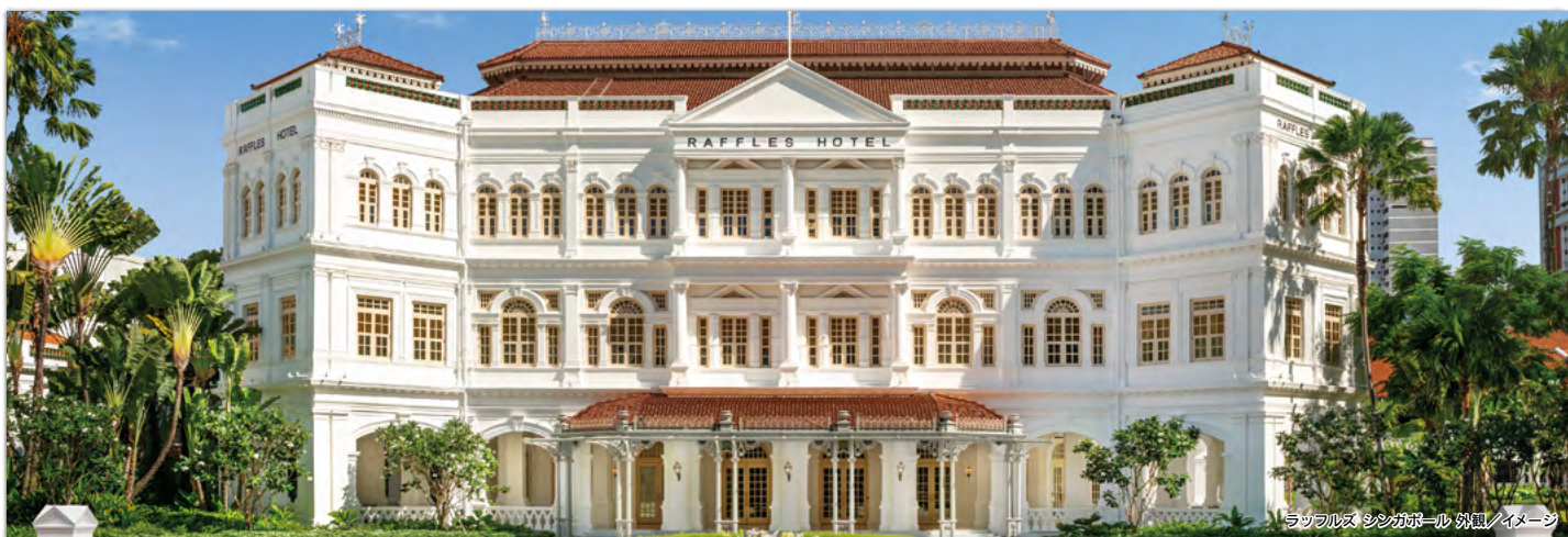
ラッフルズ シンガポール 外観/イメージ

1887年創業の東南アジアを代表する名門ホテルのひとつです。白色の美しいコロニアル様式のホテルには伝統の風格が漂います。2019年8月に全面リニューアルオープンしました。