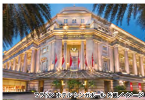
フラトンホテルシンガポール 外観/イメージ