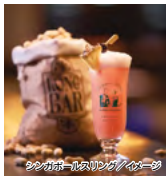
シンガポールスリング/イメージ