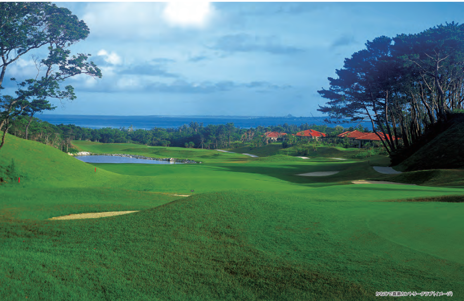
かねひで喜瀬カントリークラブ(イメージ)