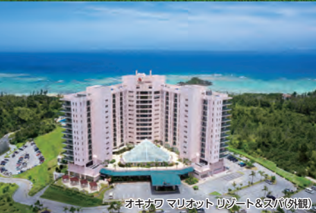
オキナワ マリオット リゾート&スパ(外観)