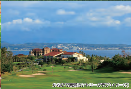
かねひで喜瀬カントリークラブ(イメージ)