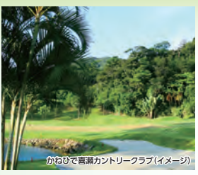
かねひで喜瀬カントリークラブ(イメージ)