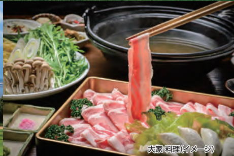
大家料理(イメージ)