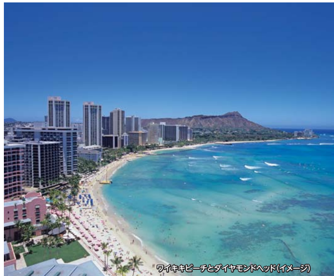
ワイキキビーチとダイヤモンドヘッド(イメージ)