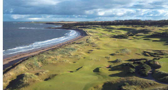
キングスパーズゴルフリンクス 18H 6,807Y P72