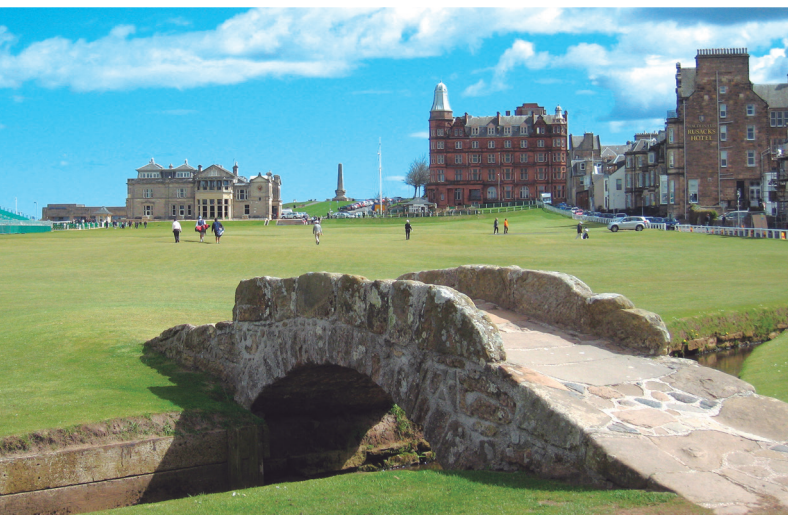
セントアンドリュース・オールドコース 18H 6,721Y P72 過去29回全英オープン開催(次回2021年)