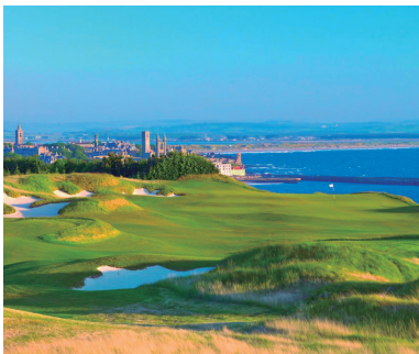
セントアンドリュース・キャッスルコース 18H