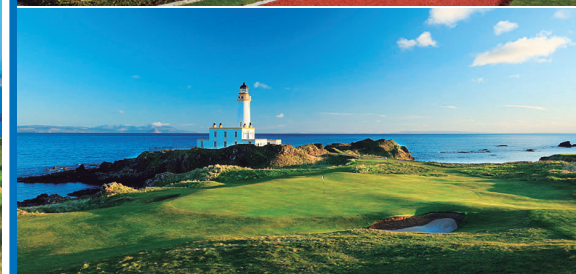
ターンベリーGC・アイルサコース 18H 6,474Y P71 1900年開場