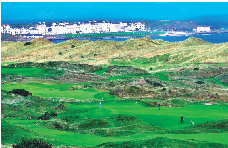
ロイヤルポートルラッシュGC・ダンルースコース 18H 6,845Y P72 パレーコース 18H 6,336Y P71 設計ハリー・コルト 1888年開場

北アイルランド・ロイヤルポートルラッシュGCで決勝ラウンドを観戦し、海を渡ってスコットランドの“ターンベリー”と聖地“セントアンドリュース”をプレイする夢のプランです。