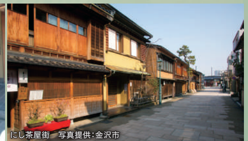
にし茶屋街