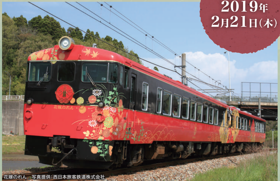
花嫁のれん