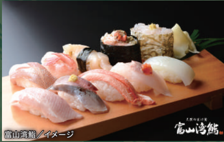
富山湾鮨/イメージ

「天然の生け簀」と称される富山湾から揚がる旬の地魚と、米どころが誇る地産米。2つの幸が重なる絶品鮨は、富山を訪れた人だけが出逢える口福です。