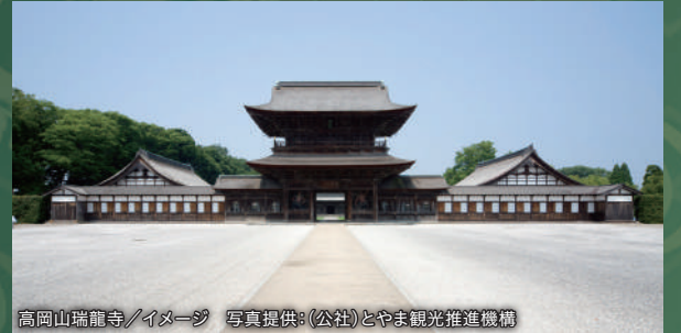
高岡山瑞龍寺/イメージ

国宝の山門、仏殿、法堂をはじめ、境内のさまざまな建造物が重要文化財に指定されている、歴史的にも貴重な禅宗寺院です。広大なスケールの伽藍でありながら、建物ひとつひとつが美しい、国宝 高岡山瑞龍寺をご堪能ください。