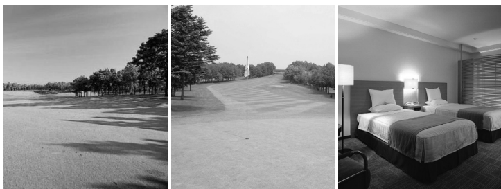
北海道クラシックゴルフクラブ 札幌ゴルフ倶楽部 輪厚コース ホテルオークラ札幌 客室