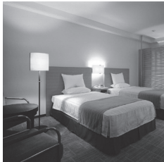
ホテルオークラ札幌 客室 イメージ