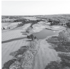
北海道クラシックゴルフクラブコース イメージ