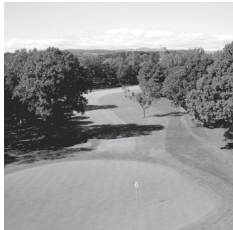
札幌ゴルフ倶楽部輪厚コース イメージ