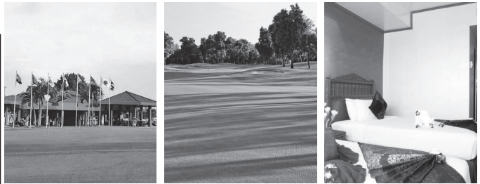
グリーンパレーカントリークラブ ラムルッカカントリークラブ バンコクセンターホテル 客室

出発日(2018年)と旅行代金(大人おひとり様(6歳以上)2名様一室利用の場合)